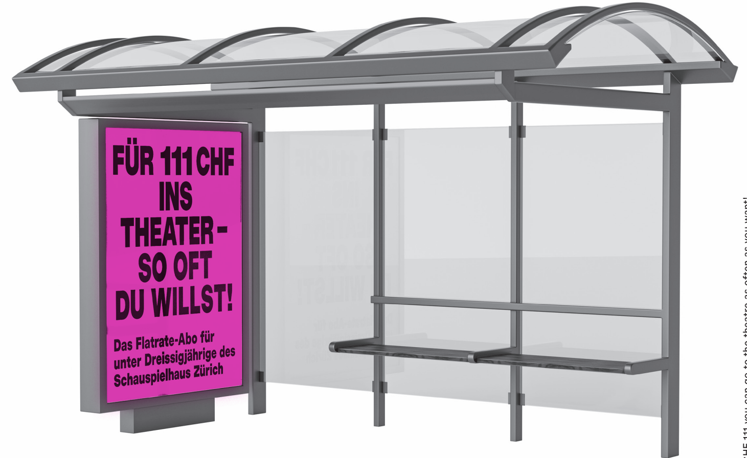
For CHF 111 you can go to the theatre as often as you want! The Flatrate Under 30 subscription of the Schauspielhaus Zürich

20., 21. & 22. November 2019, Pfauen: CHF 20–98 / CHF 10–49*